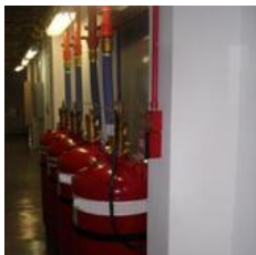
Sistema de Extinção