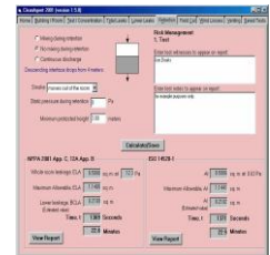
Cálculo & Laudo

A EverSys executa testes de estanqueidade, estritamente conforme a NFPA, usando a tecnologia Fan Door da Retrotec Energy Systems – USA .